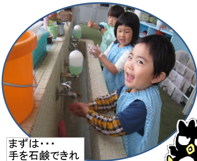
まずは・・・ 手を石鹸できれい にします