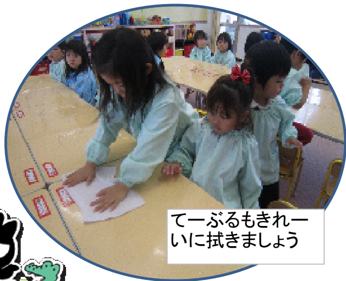
てーぶるもきれー いに拭きましょう