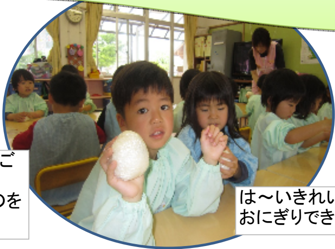
は〜きれいな おにぎりできたよ