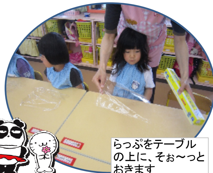
らっぷをテーブ ルの上に、そお〜と おきます