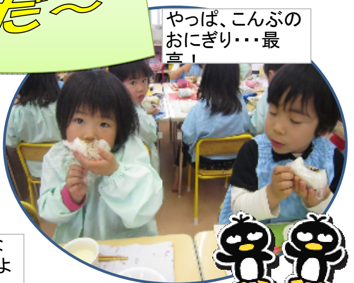
やっば、こんぶの おにぎり・・・最 高！