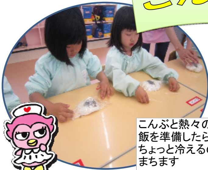
こんぶと熱々のご 飯を準備したら ちょっと冷えるのを まちます